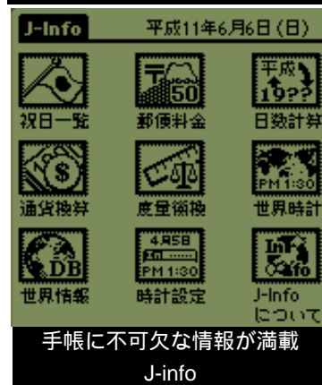
手帳に不可欠な情報が満載 J-info