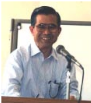
まずは、照井副会長の司会で始まりました。 いつもごろうさます。