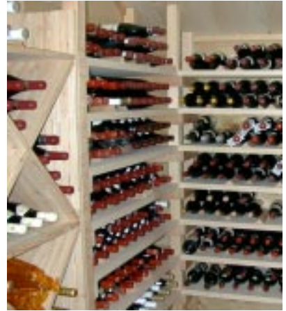
ワイン庫内 ワインと柵