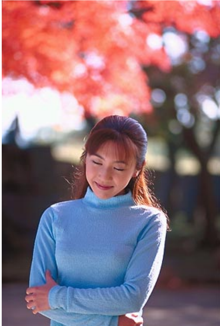
Carl Zeiss Sonnar T*135mmF2.8 F2.8-auto KODAK EA