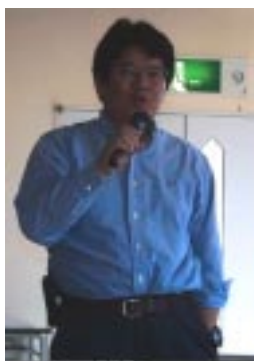
藪前編集長の近況報告です。

私、できれば横になってポーとしている方が好いので すが、新しい世界にチャレンジ！がんばりたいと思いま す。