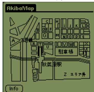
こさビーの秋葉マップ（便利）

また、数多く出回っているソフトを自由に組み込んで、機能を追加できるのも大きな魅力です。最後に私が愛用している便利なソフトを少し紹介しておきましょう。