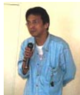
アドミニ（めぐみのサーバー 管理者）の土村講師